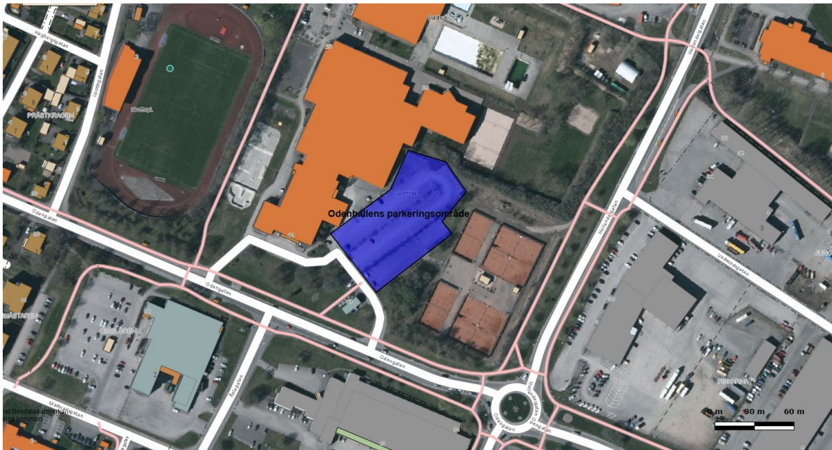
Figur 1 Parkeringsområdet vid Oden hallen

Detta är en enklare studie där enbart andelen beläggning inom parkeringsområdet vid Odenhallen har studerats. Det resultat som efterfrågas är hur stor del av parkeringsområdet som är belagt under skol- och verksamhetstiden för elever och personal. Tid som avses här är vardagar mellan 08:00 och 16:00 som kan anses vara den tid då störst antal elever och personal är på plats i skolan. Syftet är att presentera ett underlag som kan användas vid en diskussion om parkeringsområdet vid Odenhallen skulle kunna komma att användas som personalparkering för elever och personal som kommer att få det nya högskoliet som skol- och arbetsplats, det vill säga om det är möjligt att samnyttja parkeringsplatserna. Studien kan inte besvara frågor om vilken kategori som parkerar inom parkeringsområdet, hur länge de som parkerar inom parkeringsområdet står parkerade i följd eller hur stor andel som är felparkerade.