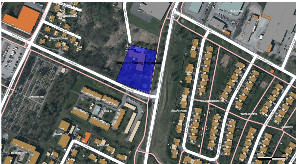
Figur 2 Lokalisering för nytt högstadie

Det nya högstadiet planeras att förläggas till fastigheten Gamla stan nordväst om korsningen mellan Trädgårdsgatan och Hollendergatan. Inom området är det tänkt att det skall finnas parkeringsområde men då det eventuellt kan behöva kompletteras med alternativa parkeringsplatser undersöks andra möjligheter. I närheten finns parkeringsområdet Hästbacken men denna parkering är i första hand avsatt för stadens besökare. Tider för handel har i stort samma tidsspänn som för de verksamma och utgör därför inget alternativ för samnyttjande. I Odenhallen är det verksamheter främst på kvällar och helger med hänseende på inkommande resenärer varför den skulle kunna vara ett alternativ för samnyttjande.