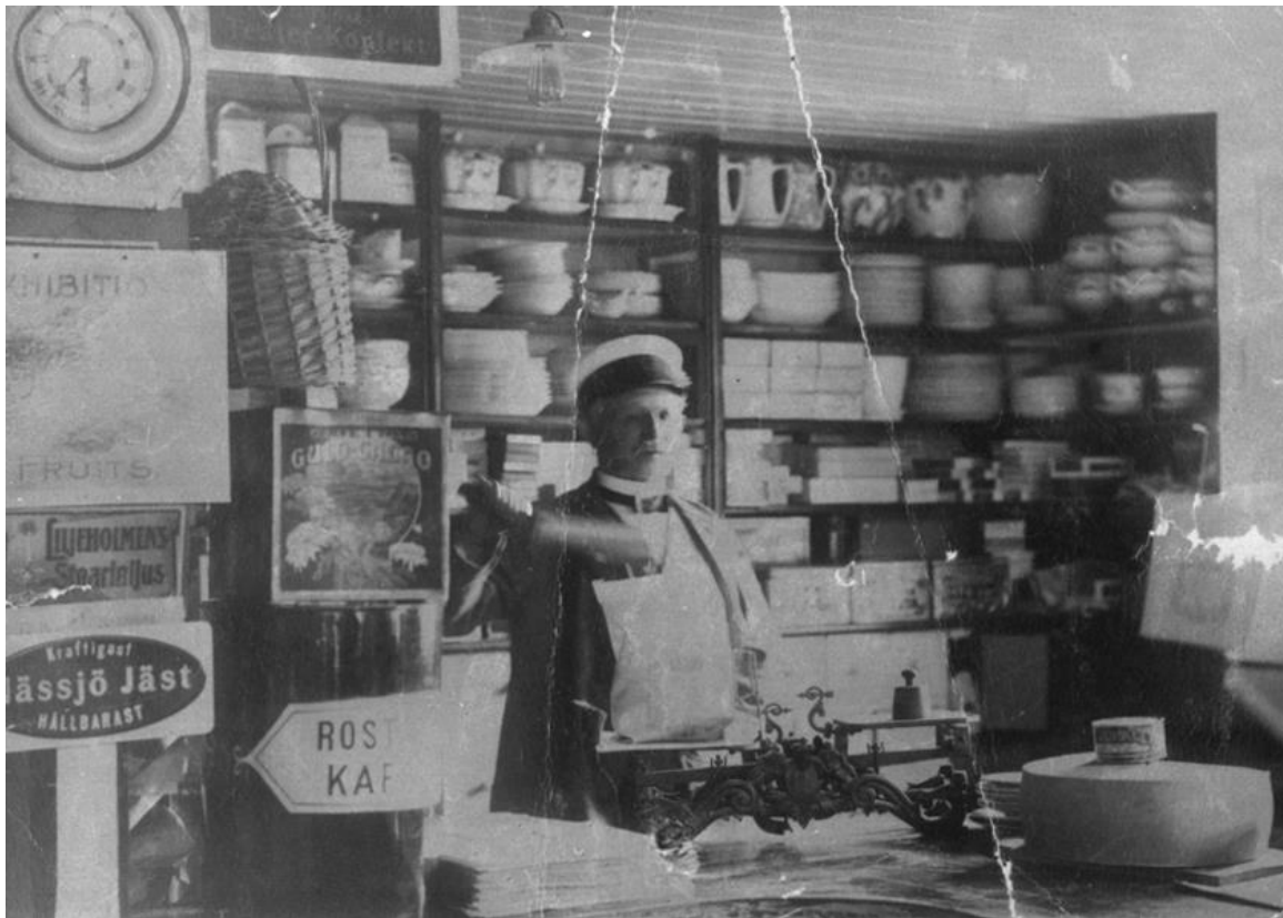
Diversehandel, omkr 1915. Bakom disken står handelsmannen själv och väger upp, kanske kan det vara kaffeböner på taffelvågen med vikter. Till vänster på bilden ses reklam för bl.a. Liljeholmens stearinljus, Nässjö jäst och Guld Cacao. På disken ligger osten med en snusburk ovanpå! I hyllorna bakom disken ses det karaktäristiska sortimentet med porslinskannor, fat, kartonger och förpackningar av olika slag.