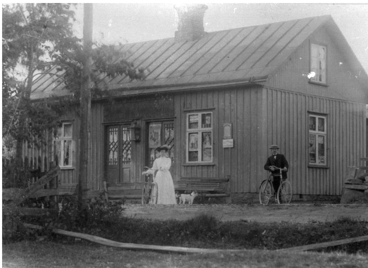
Adolf Karlssons Speceri- och Diversehandel, Alfhem, Stenstorp, 1904. Utanför affären ses den då så vanliga reklamen för Pellerins margarin och "Det bästa hvetemjölet" från Malmö stora Walskvarn.

I adresskalendern från 1880 omnämns endast 2 handlande, vilket visar utvecklingen under slutet av förra seklet.