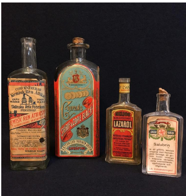
Glasflaskor var långt ifrån standardiserade vid 1900-talets början.