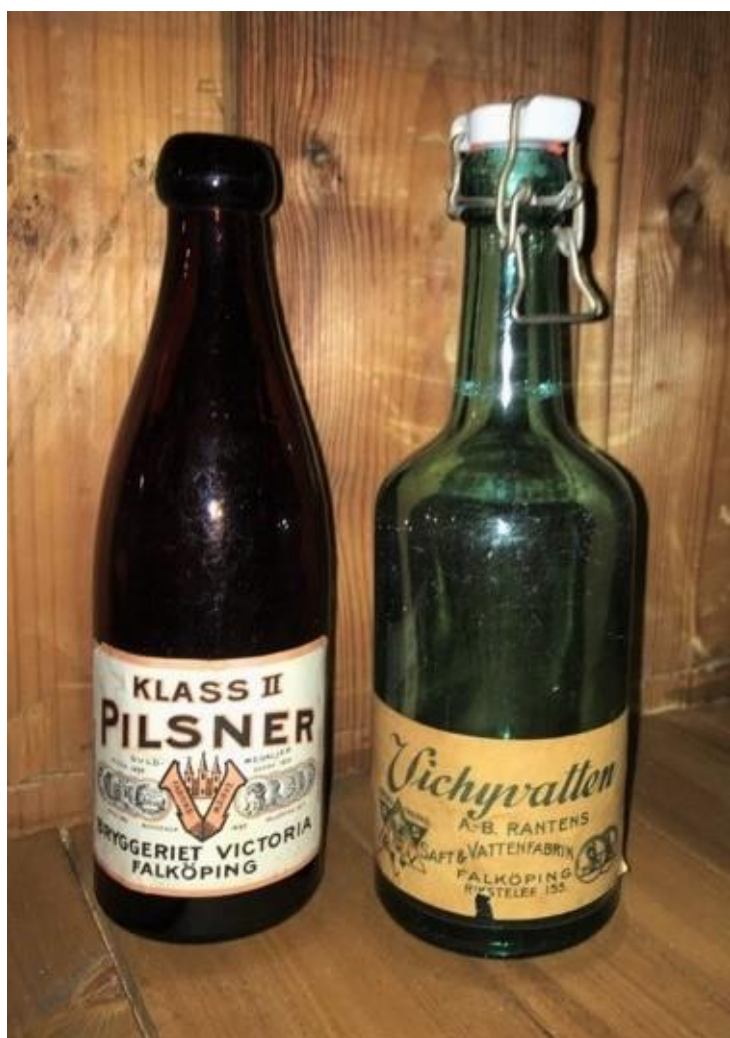
Ölflaska från Bryggeriet Victoria, Falköping, och Vichyflaska med pantentkork från AB Rantens Saft- och Vatten Fabrik, Falköping.

Handelsboden var också en samlingspunkt för byn där man träffades och pratade. Pallen att sitta på hade sin givna plats i affären. Det klagades aldrig över köer utan istället blev väntetiden ett utmärkt tillfälle till sociala kontakter. Expedieringen tog tid. Handelsmannen eller bodbiträdet skulle hämta alla varorna. Mjöl eller kaffe skulle vägas och förpackas. Karameller såldes i strut etc. Kunderna fick vanligen kredit och varorna skulle därför noteras i en speciell bok. Den då så vanliga prutningen på priserna tog också den sin tid.