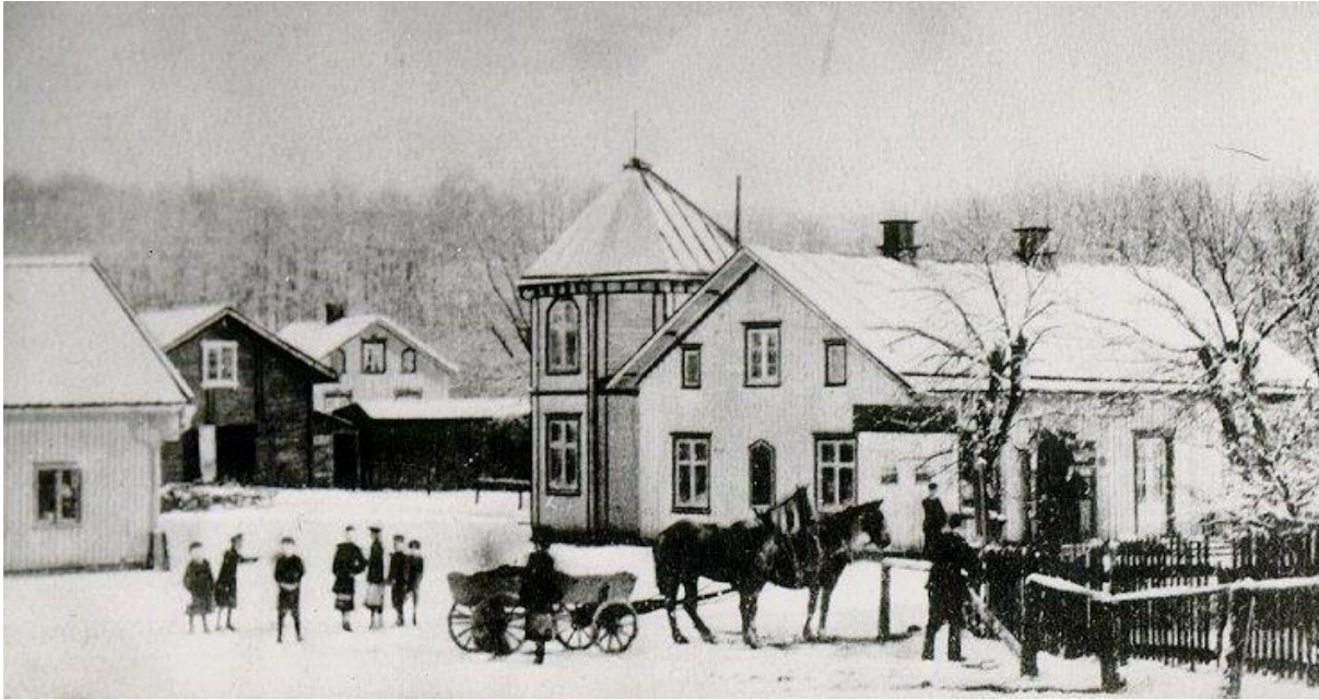
Brynolf Wilanders manufaktur-, speceri- och diversehandel, Floby, efter tillbyggnaden i början av 1900-talet. Till vänster skymtar Johan Strömbergs handelsbod som eventuellt är den första affären vid Sörby station. Under 1870- 90-talen drev han en betydande handel med spannmål och lantmannaprodukter.