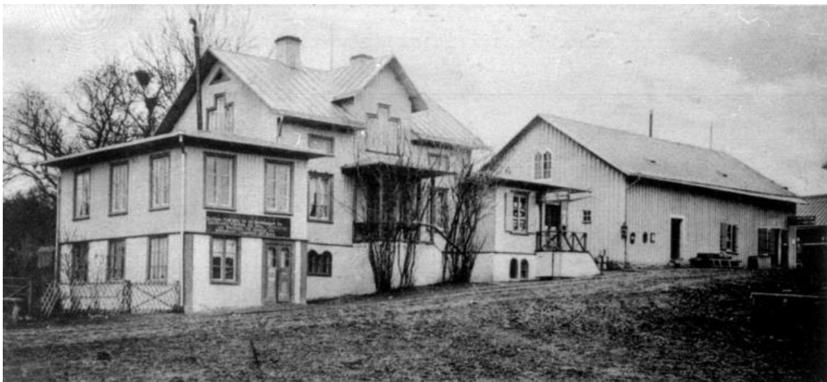
August Bergströms diversehandel, Jonsberg, Stenstorp.