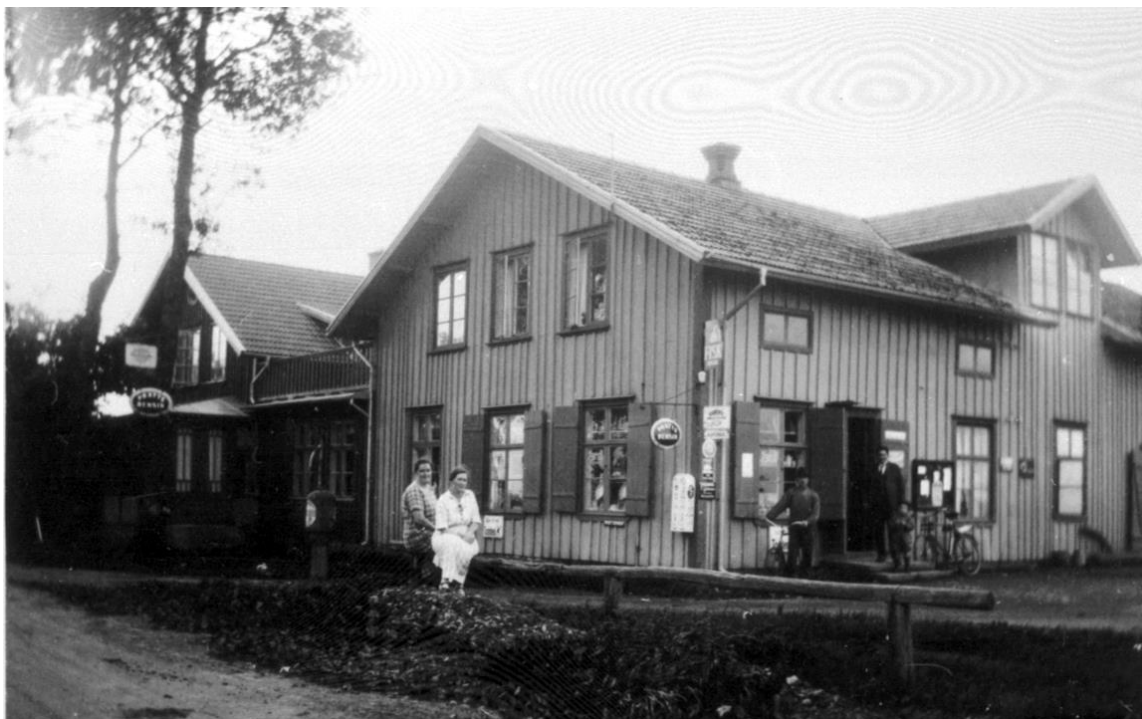
Ömans handelsbod Aspenäs, Floby.