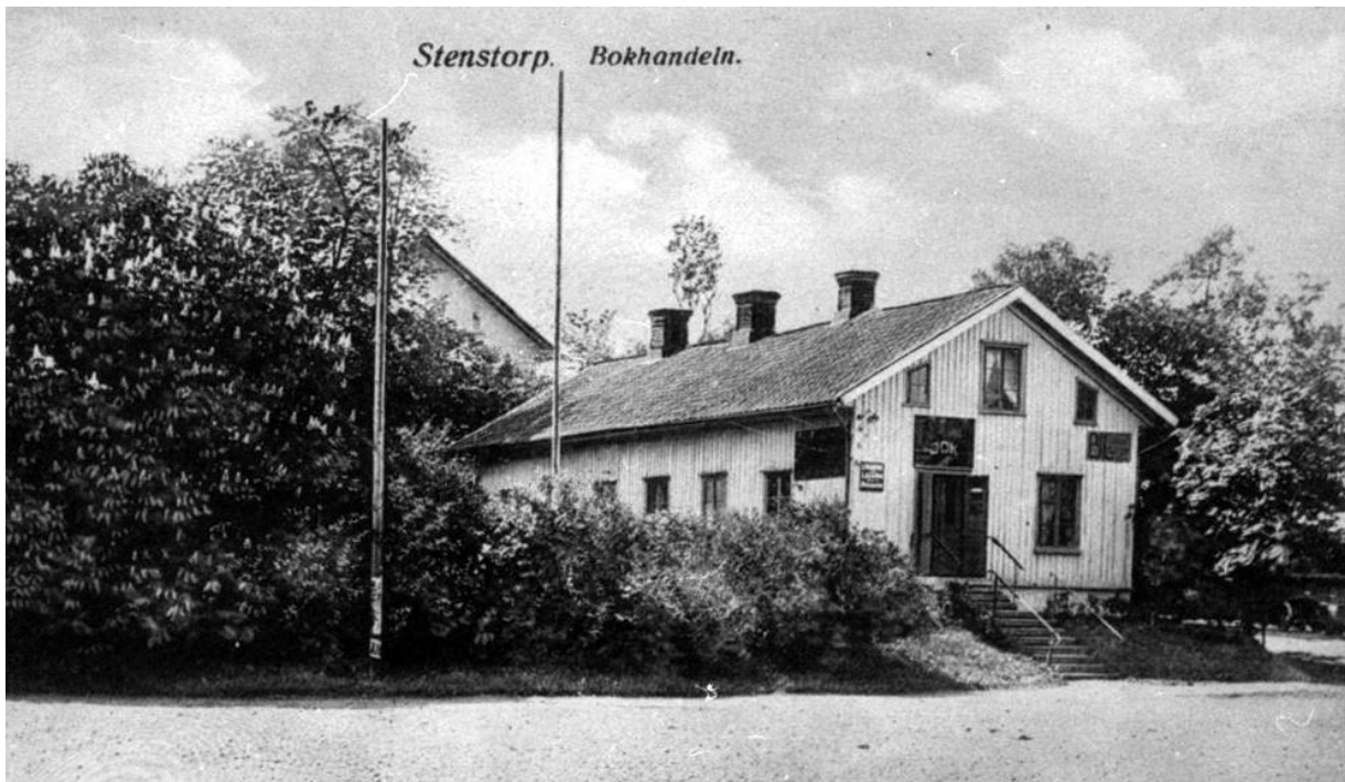
Bokhandeln i Stenstorp. Där var även postkontoret var inrymt 1879-1896.

Då de smalspåriga banorna till Hjo och Skara öppnades 1873-74 blev tillväxten i samhället allt livligare. Mellan åren 1859 och 1873 byggdes endast 2-3 nya hus, men under den följande perioden fram till sekelskiftet byggdes sammanlagt ett 50-tal byggnader.