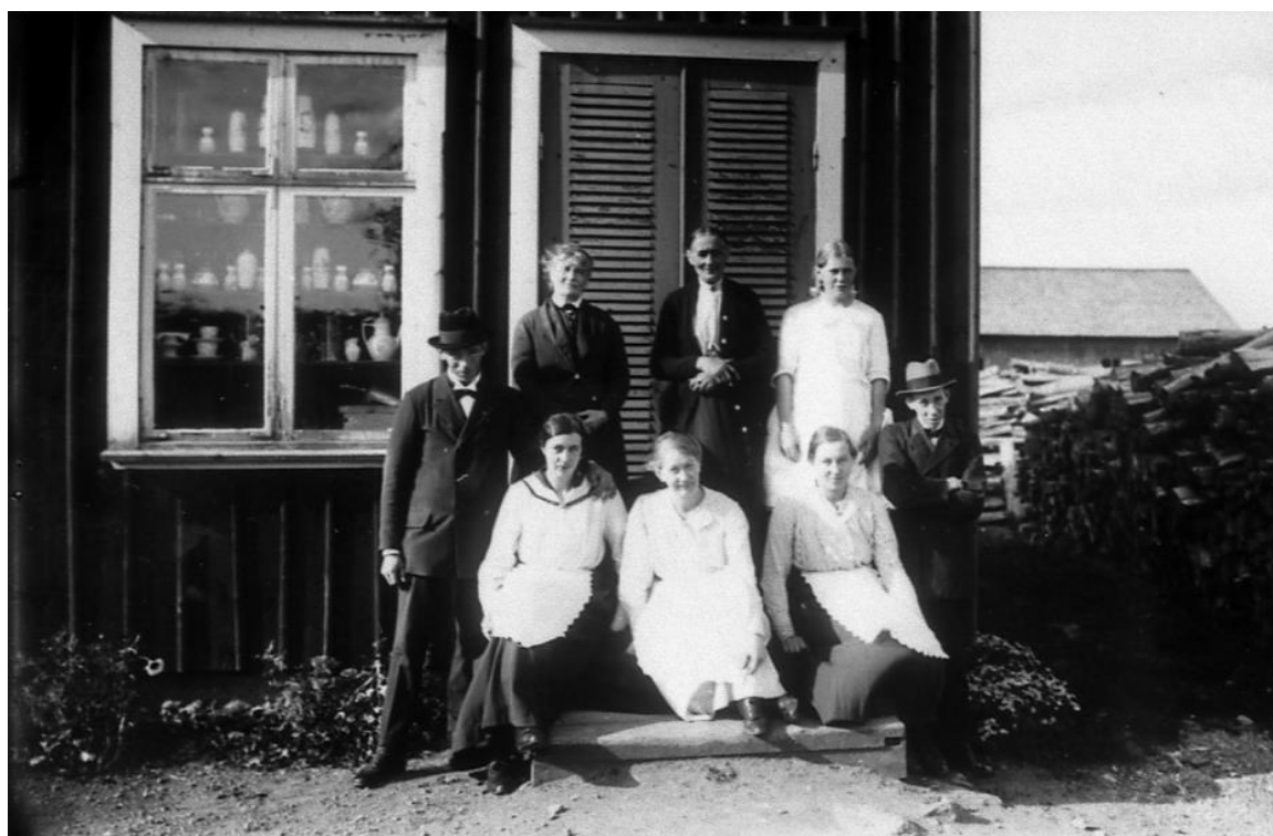
"Filialen", Ömans handelsbod, Heden, 1919. Fönstret var inte i första hand ett skyltfönster, men visar att all plats i butiken användes för att exponera varor.