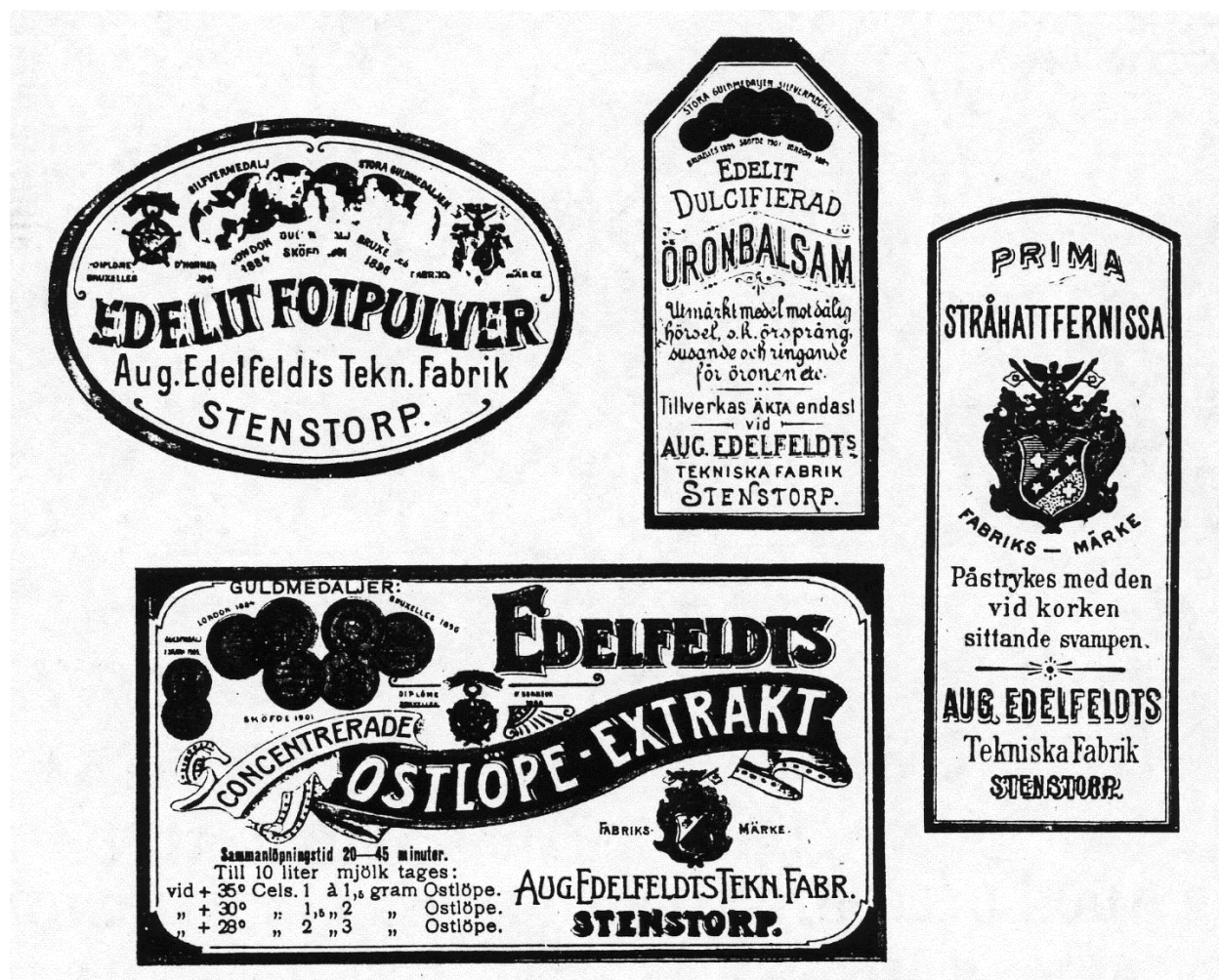
Etiketter från Aug. Edelfeldts Tekniska Fabrik, Stenstorp.