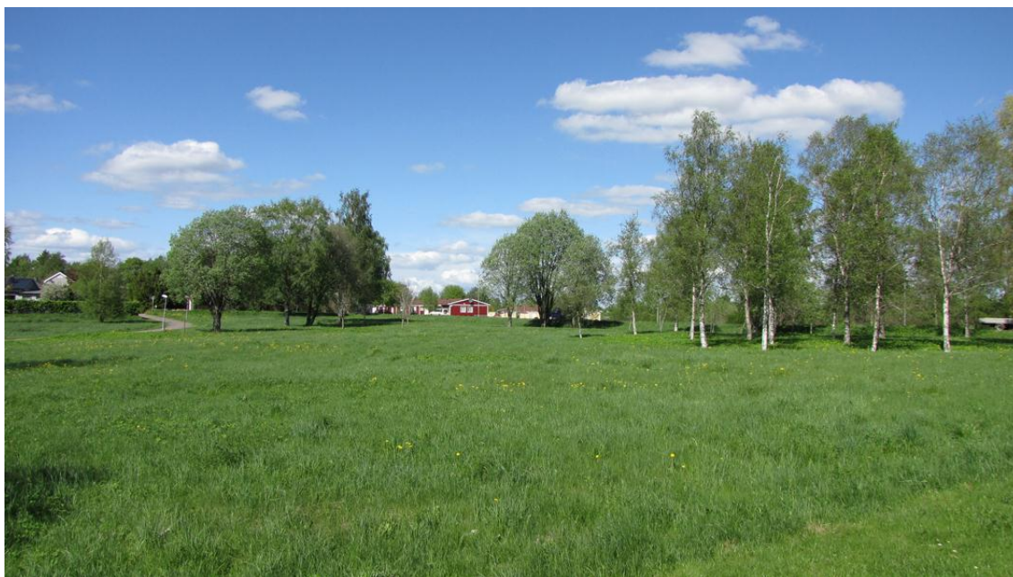
Figur 2 visar vegetationsförhållanden i planområdet

De befintliga träden inom området har utretts av kommunen. Kommunen bedömer att det inte finns några skyddsvärda träd inom området. Kommunen anser också att man vid detaljprojekteringen måste ta stor hänsyn till den befintliga naturmiljön, och träden måste bevaras så långt som möjligt. Planen rekommenderar också att fällande träd ersätts med nya träd. Vid trädplantering måste trafiksäkerhets frågor beaktas särskilt.