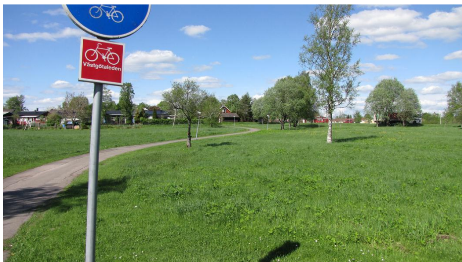
Figur 3 visar GC-bana i väster av planområdet