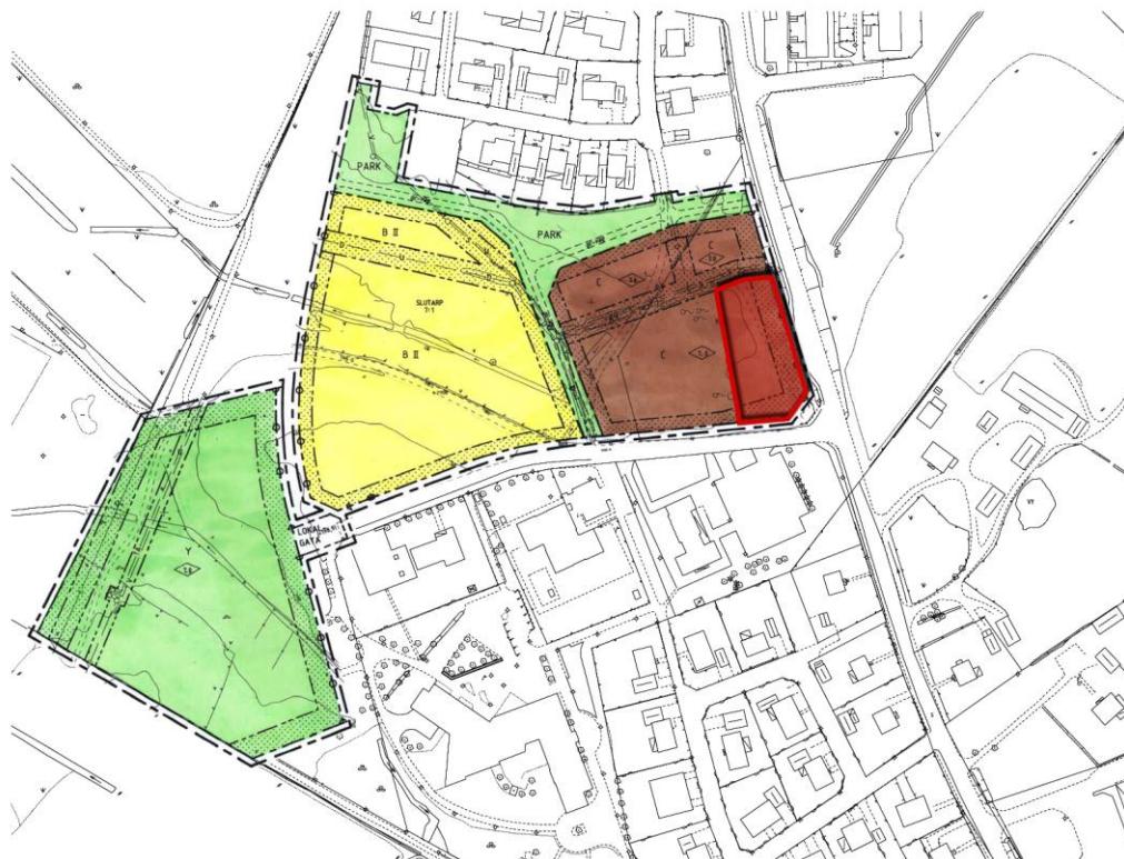
Figur 1 visar gällande detaljplan. Den delen som berörs av planersättningen har markerats

Den nya detaljplanen kommer att ersätta en del av den gällande detaljplan i öster. De nya busshållplatserna kan betraktas som tillgång för de affärer som kommer att etableras i centrum området. I andra sidan, kommer planen att minska den ytan som kan användas för uppförande av bostäder och affären.