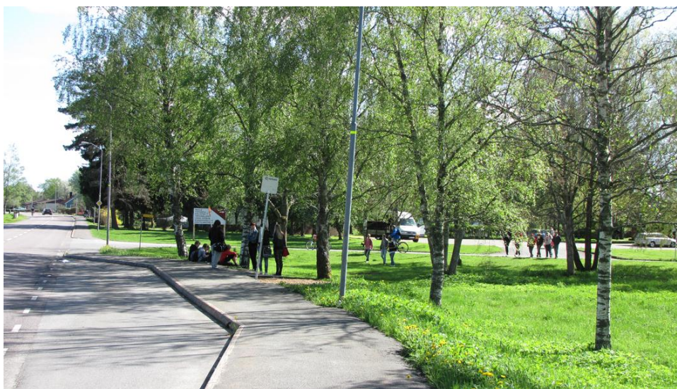
Figur 5 visar den befintliga busshållplatsen

busshållplatsen saknar bänk och väderskydd.